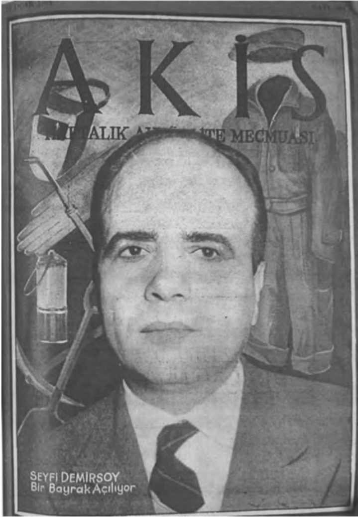
Demirsoy Çalışanlar Partisi Girişimi Sırasında Akis Kapağında.