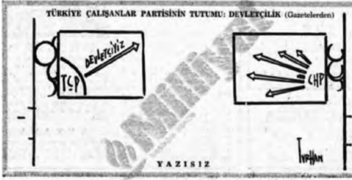
Turhan Selçuk'tan TÇP ve CHP Üstüne

Ecevit, Britanya Ankara Büyükelçisine, Türkiye koşullarında büyük siyasi amaçları başaramayacak olan böyle bir partinin kuruluşuna şiddetle karşı olduğunu söylemektedir. Büyükelçilik raporuna göre, yeni partiye yönelik desteğin artması CHP'de endişeye yol açmış ve özellikle Bahir Ersoy'un yeni partiyi desteklemesi CHP'yi alt üst etmiştir. Rapor, yeni partinin CHP'nin sol kanadının desteğini alabileceğine ve bazı Parti Meclisi üyelerinin CHP'den ayrılıp yeni partiye katılabileceklerine yönelik spekülasyonlar olduğunu bildirmektedir. 94 Ecevit'in TÇP girişimine karşı çıkışının Türk-İş üzerinde de etkili olduğunun bir işareti Halil Tunç'un TÇP girişiminin içinde yer almayışıdır. Genel Sekreterliği döneminde Ecevit'e yakınlığı ile tanınan Tunç, Ecevit'in tutumuna paralel olarak TÇP girişimcileri arasında yer almamış ve karşı çıkmıştır: